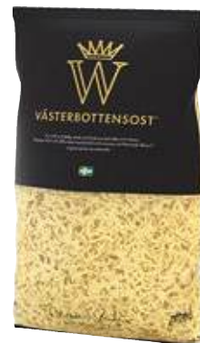
VÄSTERBOTTENSOST NORRMEJERIER Riven, 2 kg/st

Färsk 08454 Sverige 4 kg/krt 375.00 kr/st