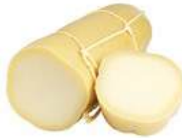
PROVOLONE PICCANTE WIJNJAS Lagrad i 4 månader, 1 kg/st