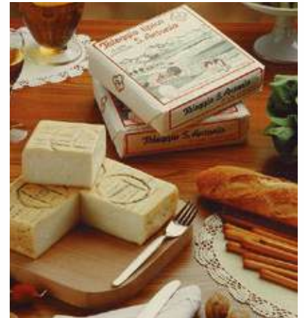
TALEGGIO D.O.P. WIJNJAS