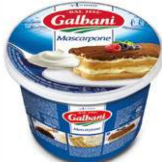
MASCARPONE GALBANI 500 g/st