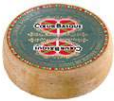
COEUR DE BASQUE WIJNJAS Lagrad i 3 månader, 1 kg/st