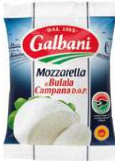
MOZZARELLA GALBANI 125 g/st