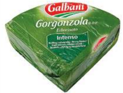
GORGONZOLA D.O.P. GALBANI Intenso, 1,5 kg/st