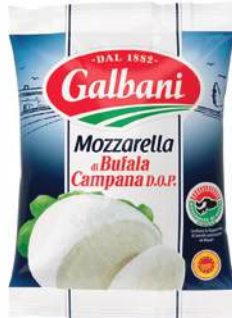
BUFFELMOZZARELLA GALBANI 125 g /st