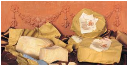
PECORINO CACIO DI FOSSA IL FORTETO Fårost, grottlagrad i 6 månader, ca 1,5 kg/st