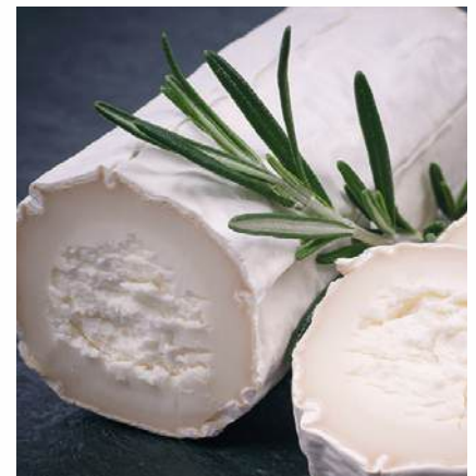
GETOST CHÈVRE UHRENHOLT 1 kg/st