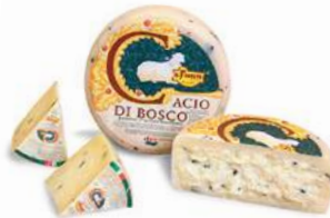
PECORINO CACIO DI BOSCO Pecorino med tryffel, lagrad i 15 månader, 1,75 kg/st