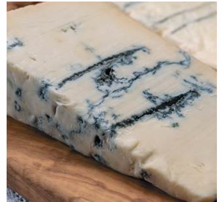
GORGONZOLA D.O.P. GALBANI Intenso, 1,5 kg/st