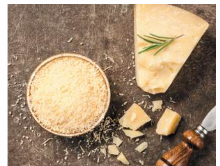
PARMIGIANO REGGIANO D.O.P. GRANTERRE