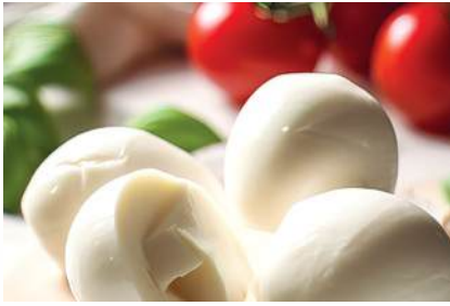
COCKTAILMOZZARELLA GALBANI 1 kg/pkt